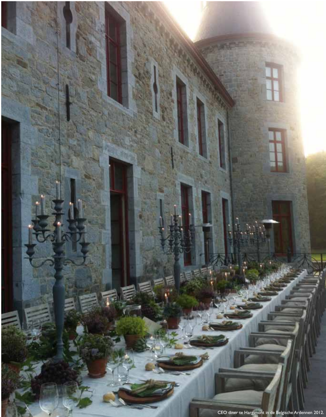
CEO diner te Hargimont in de Belgische Ardennen 2012.