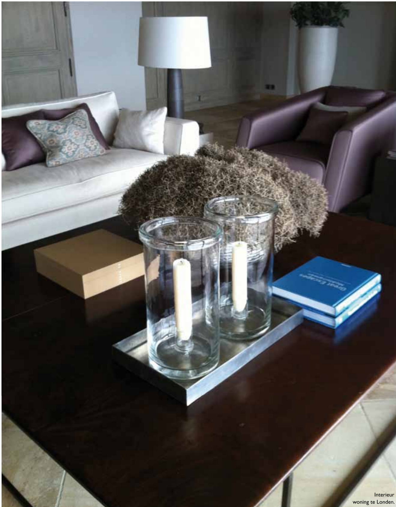
Interieur woning te Londen.