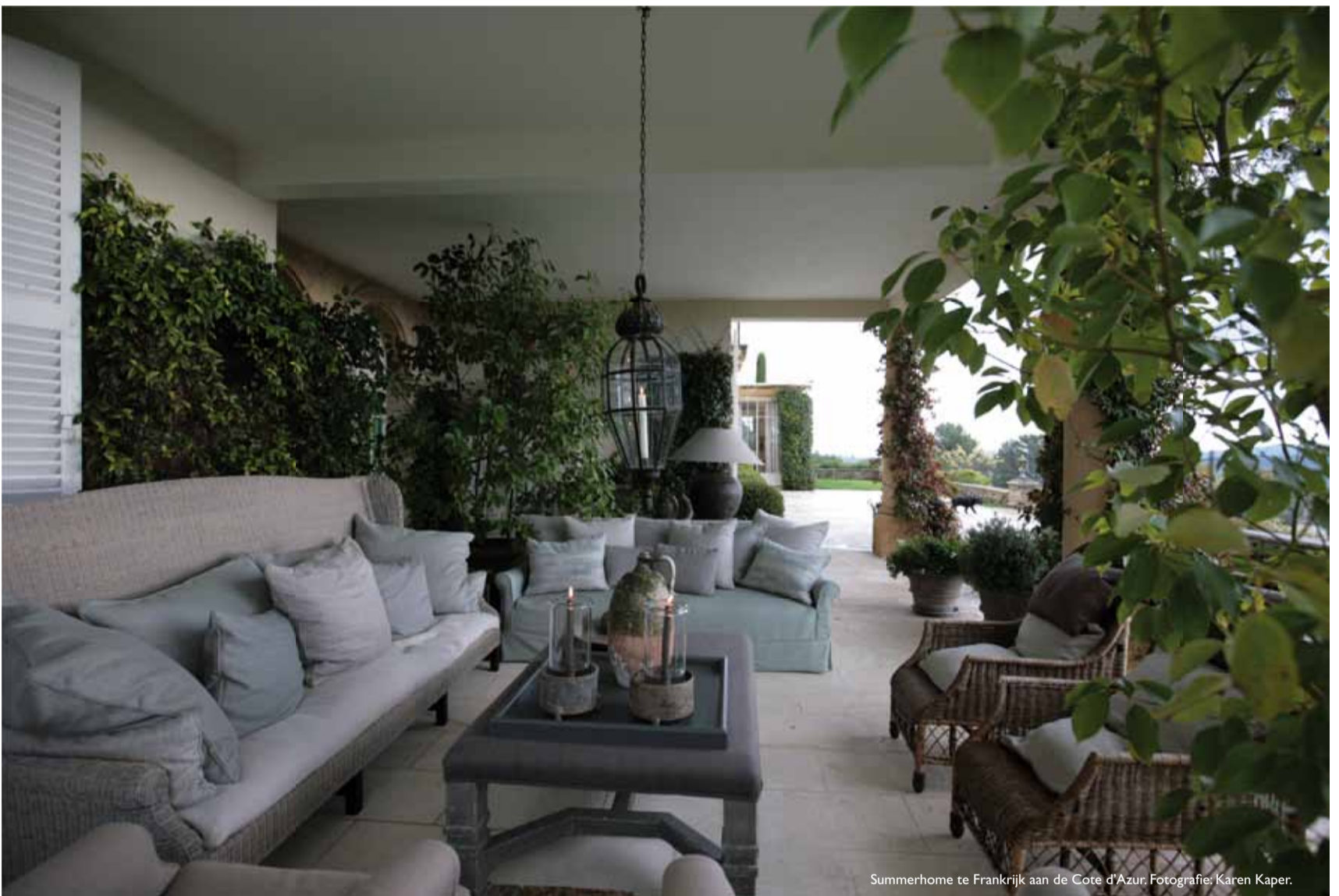
Summerhome te Frankrijk aan de Cote d'Azur.

Van het dekken van de tafel tot het verzorgen van de cateraar en de muziek. Het enige wat de klant dan nog hoeft te doen, is zichzelf mooi kleden.”