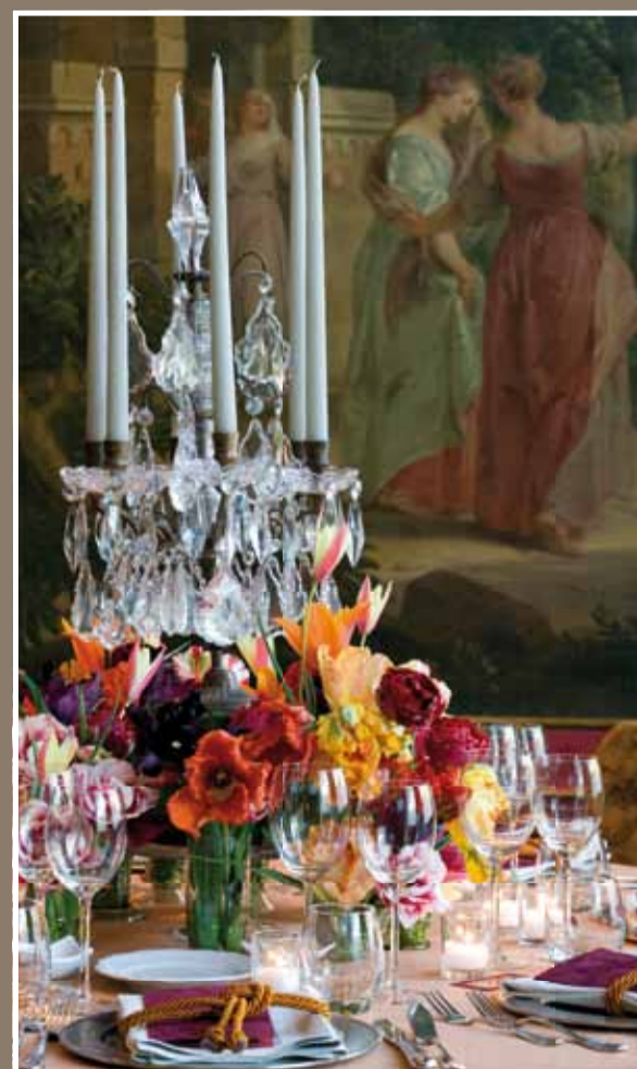
Tulpenfeest Amsterdam 2011 in "the House of Amsterdam".

Creativiteit en passie. Combineer ze met elkaar in de persoon van Paul Klunder en er ontstaan de mooiste projecten. Van de aankleding van een sprookjeshuwelijk in St. Moritz tot de inrichting van een droomhuis aan de Côte d'Azur.