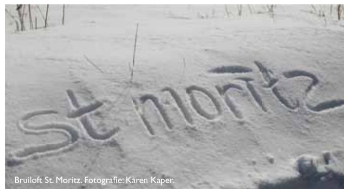
Bruiloft St. Moritz.

Suvretta House, in het Zwitserse St. Moritz, is een stijlvol vijfsterrenhotel dat een sfeer ademt van luxe en grandeur. Het doet denken aan een groot paleis en is prachtig gelegen in de Zwitserse Alpen. Een ideale plek dus voor een sprookjeshuwelijk. Aan Paul Klunder de eer om deze bijzondere dag tot in de puntjes te verzorgen. “Met twaalf man zijn we tien dagen lang bezig geweest om er iets onvergetelijks van te maken”, vertelt de ontwerper. “Van een lunch in de sneeuw tot voor elke gast bedlinnen met daarop het monogram van het bruidspaar. Voor het ritje naar de kerk stonden vijftig arrensleden klaar, met voor iedere gast een met bont bekleed drankflesje, gevuld met een goede schnaps. Een welkome traktatie bij een temperatuur van min achtien.”